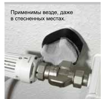
Применимы везде, даже в стесненных местах.